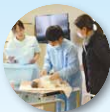
看護学科2年課程 (定時制)