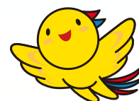
兵庫県マスコット 「はばたん」