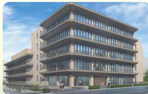
兵庫県立総合衛生学院 中山手分校外観