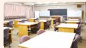
ファントム実習・歯科保健指導実習室