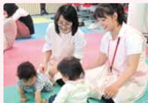
地域母子保健実習